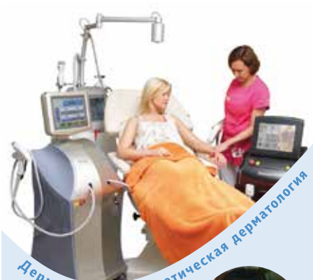
Дерматология и эстетическая дерматология