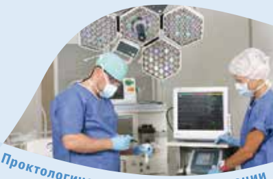
Проктологические лазерные операции